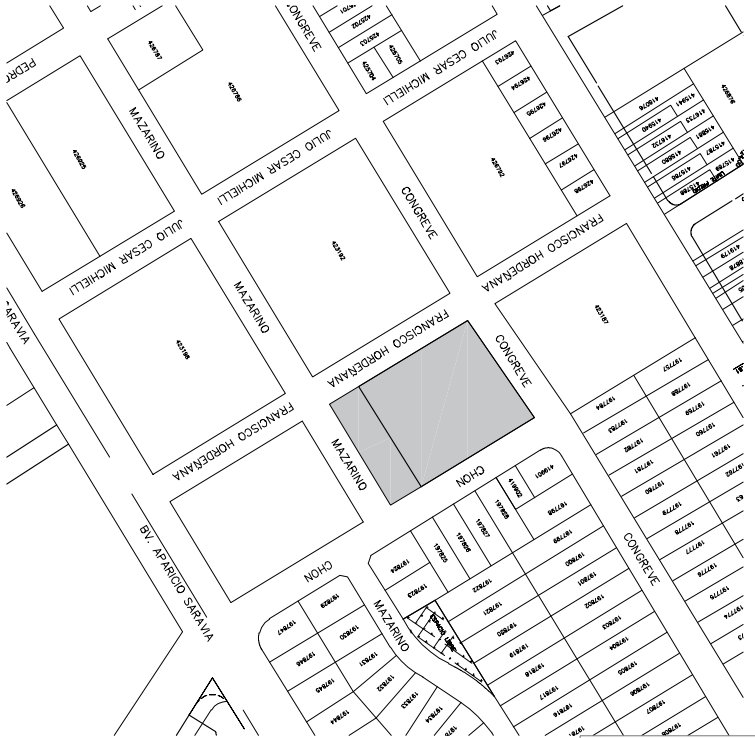
PLANO DE UBICACIÓN escala 1/4000